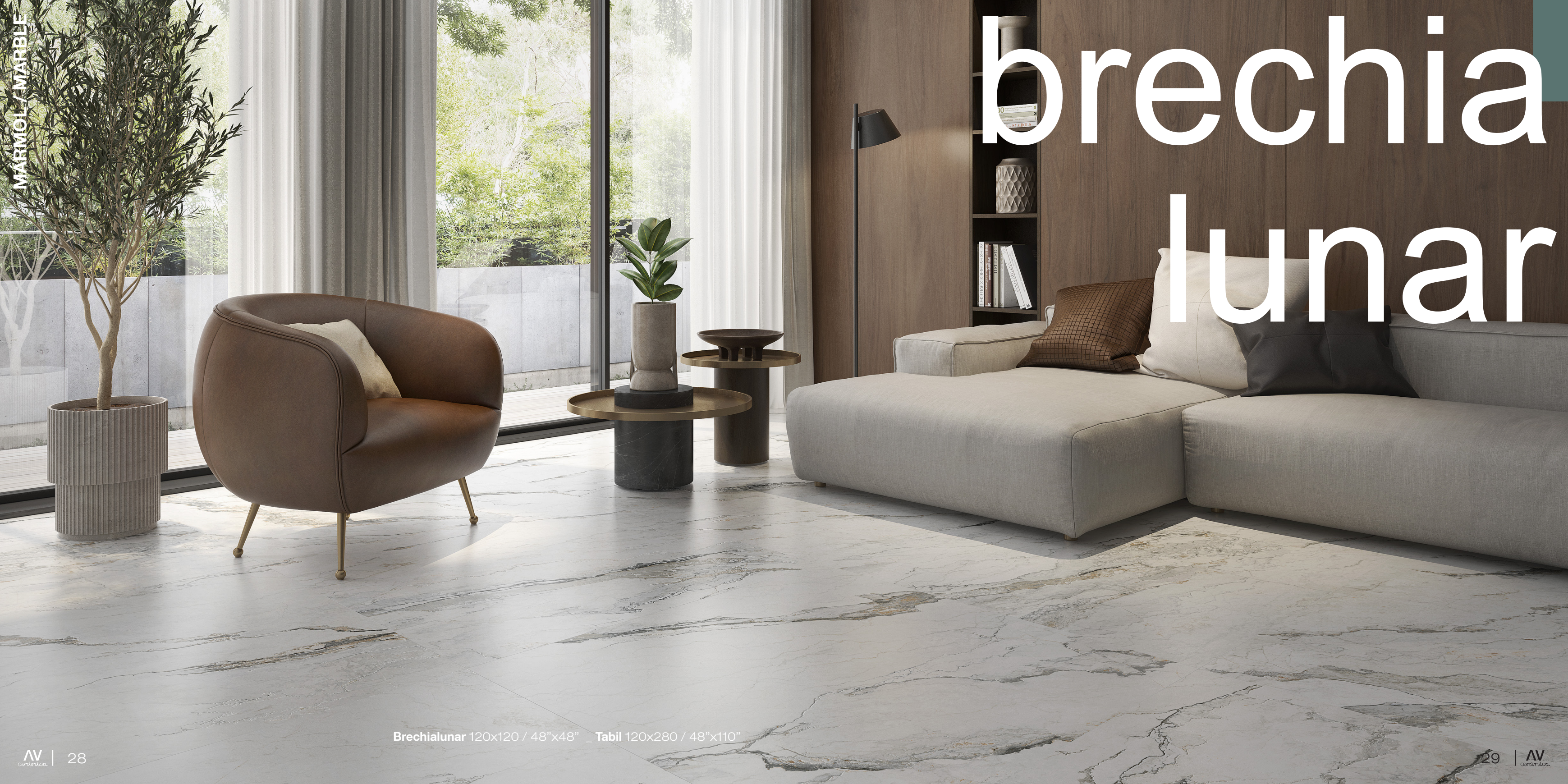
Brechialunar 120x120 / 48"x48" _ Tabil 120x280 / 48"x110"